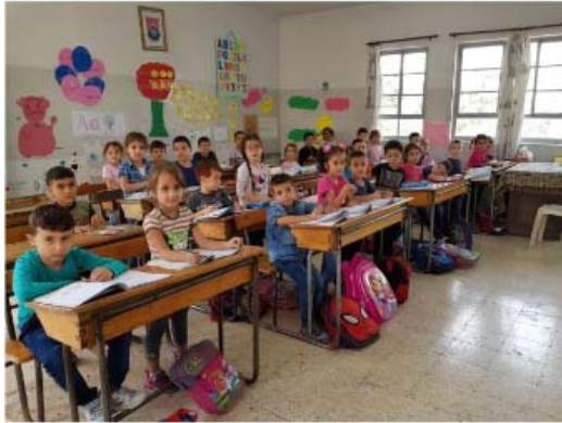
Schule in Aleppo

Vielen Dank für die zahlreich gespendeten Schulsachen und Schultaschen für Kinder in Syrien!